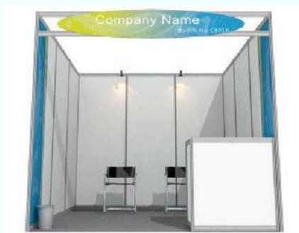
標準エリア標準ブースイメージ